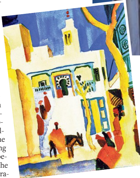
Kunstwerk So verewigte August Macke das Café des Nattes in Sidi Bou Said in seinem Werk „Blick auf eine Moschee“ (1914)