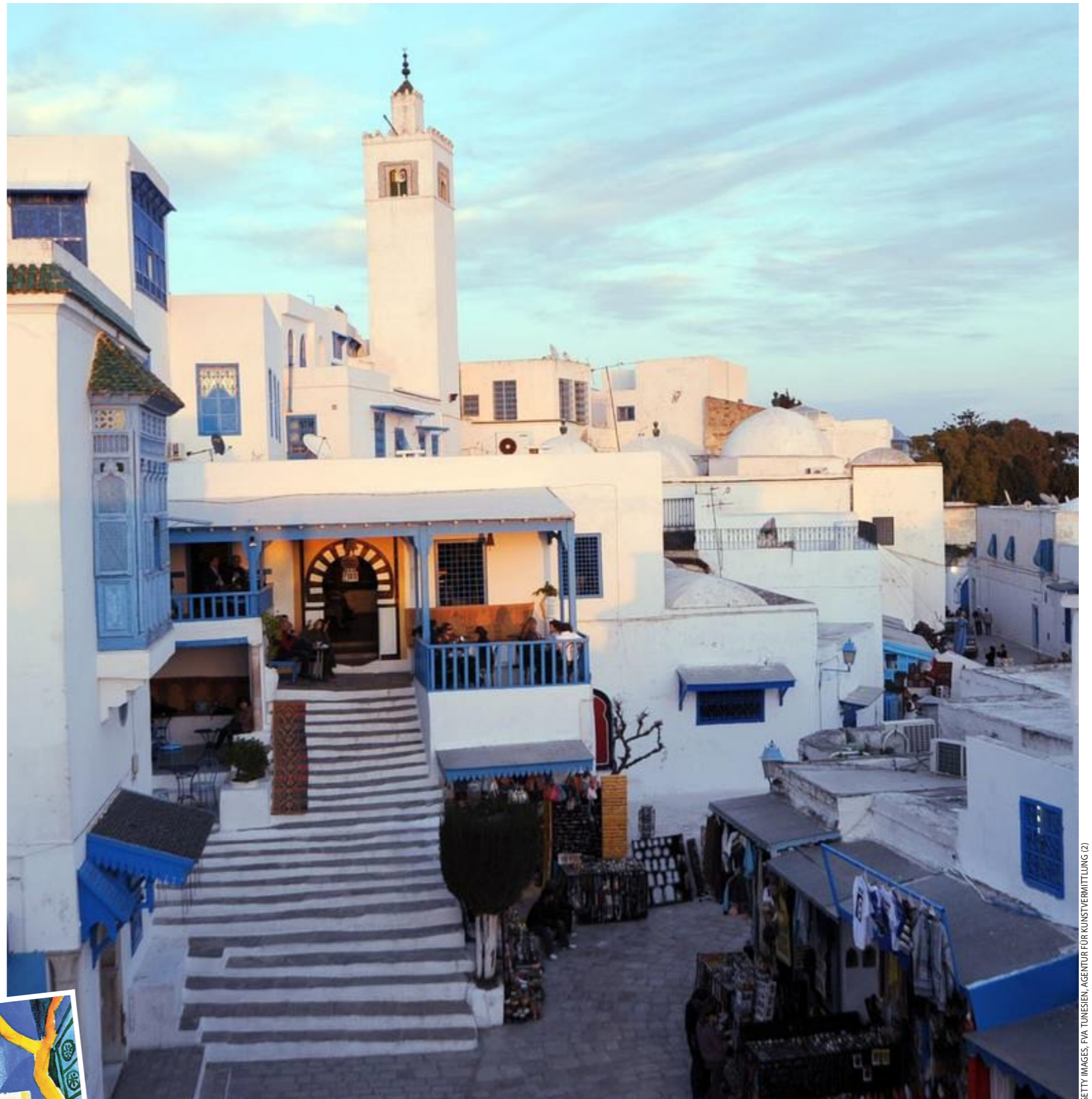
Original Das Café des Nattes im Künstlerdorf Sidi Bou Said am Golf von Tunis. Dieser Blick wurde durch das Aquarell von August Macke weltberühmt

In der riesigen Zentralmarkthalle aber entfesselt sich ein Ballett der Verführung und Zurschaustellung. Fische mit aufgerissenen, frisch-roten Kiemen werden einem entgegengestreckt, Gewürze locken in Säcken und Tüten. In der Gemüseab-